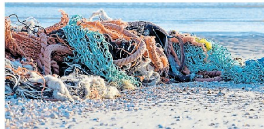
Bei den Aktionstagen auf Wangerooge geht es rund um das Thema Meeresmüll.

ben, bei dem verschiedene Akteure über die Möglichkeiten von Müllvermeidung, Upcycling und über nachhaltige Produkte im Haushalt informieren.